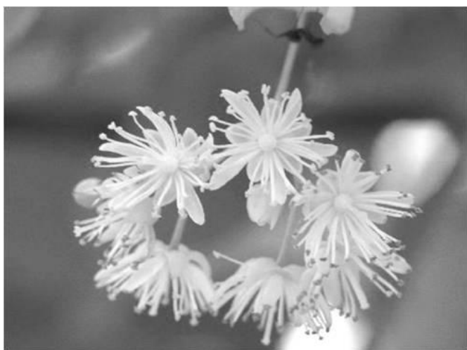
街路樹のリンデン

「7つの通りから生まれる出会いと、7つの時を刻む」並木通り独自の Original Design icon を創り上げ、並木の美しいリンデンをモチーフに、大人の街にふさわしいイルミネーションがデザインされました。